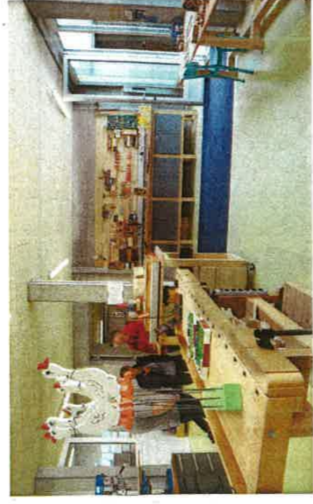
Blick in die Holzwerkstatt mit optimaler Infrastruktur im Erdgeschoss.

bau sei eben die Heimküche und der Speisesaal gewesen, sagte Hans Moser. Mit der neuen Küche ist auch eine wertvolle Verpflegung gewährleistet. Im Verbindungstrakt zwischen bestehendem Alt- und dem Neubau architektonischer Sichtweise